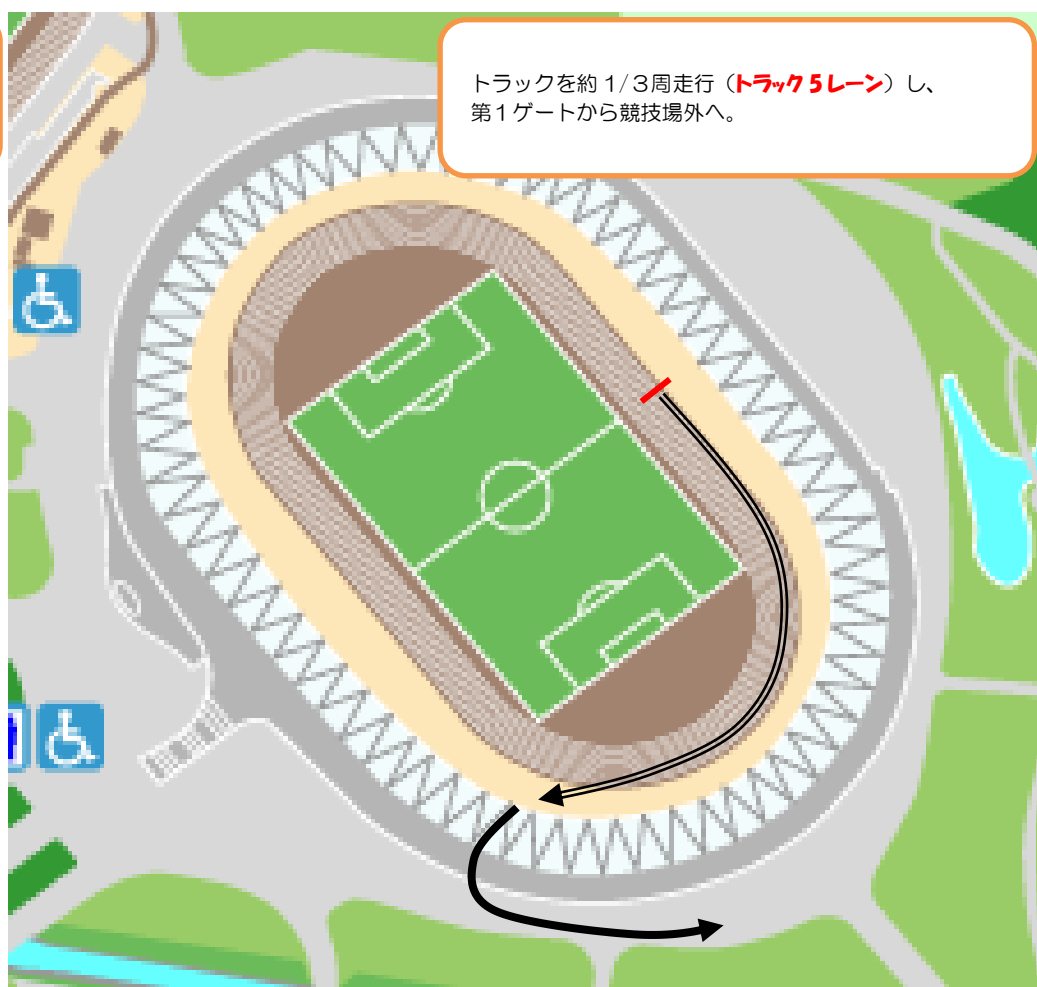
たすき渡し後 各区分スタート詳細